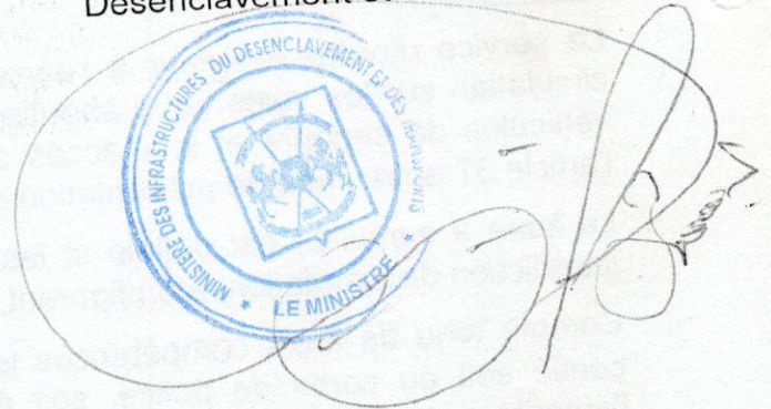
Jean Bertin OUEDRAOGO Commandeur de l'Ordre National

Le Ministre des Infrastructures, du Désenclavement et des Transports,